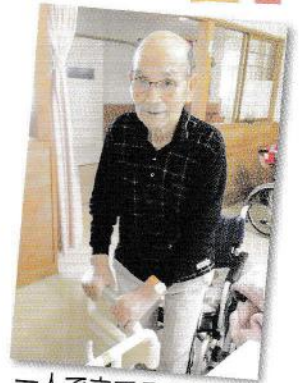
一人で立てるように なりました！！

また、自力で動くことが難しい方へは、関節拘縮を予防するために、関節可動域訓練を行ったり、安楽な姿勢を保てるよう、クッションの選定や姿勢調整を行うなど、利用者様一人一人に快適に過ごして頂けるようお手伝いしています。