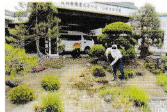
東部地区長会 様 グループホーム周辺の草刈り