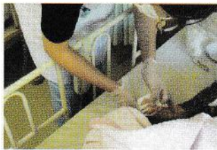
〈軟膏塗布等の処置〉