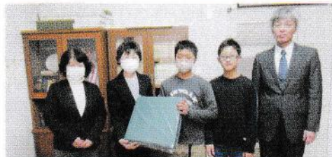
添川小学校 様 車椅子用のクッション寄贈