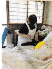
〈胃ろうの方に 栄養剤を流す〉

◎その他にも救急受診や定期受診の付き添いなど行い、入所者の皆様の異常をいち早く発見し、早期治療を図ることを心掛けています。