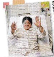
「バンザイ！」と 笑顔で体操☆