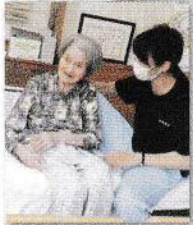
祝100歳！ いつまでも 座れるように☆