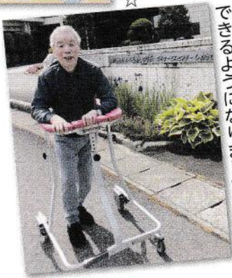
外の散歩が できるようになりました！