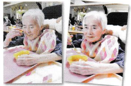
食器やスプーンを工夫して、自分で 食べられるように頑張っています！