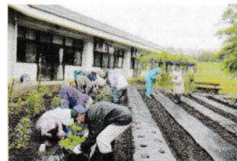
椿駅前自治会 様 中庭のコケとり