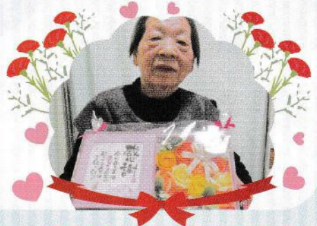
母の日のプレゼントに にっこり笑顔